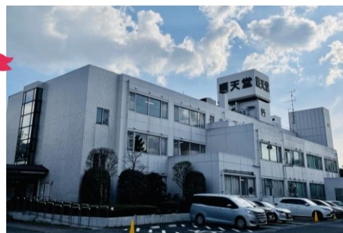
順天堂大学越谷病院