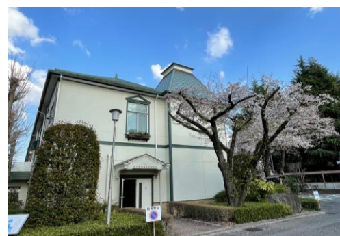
順天堂精神医学研究所