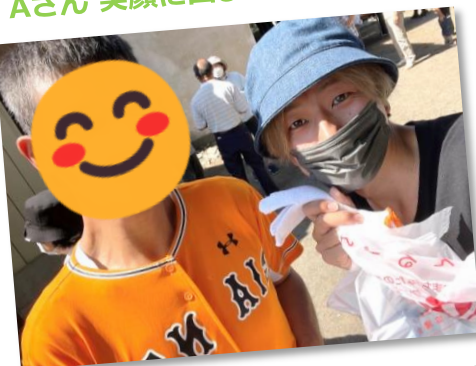
Aさん 笑顔に囲まれて充実の汗！